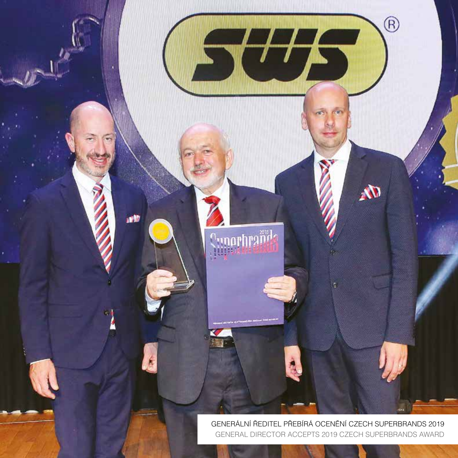
GENERÁLNÍ ŘEDITEL PŘEBÍRÁ OCENĚNÍ CZECH SUPERBRANDS 2019 GENERAL DIRECTOR ACCEPTS 2019 CZECH SUPERBRANDS AWARD